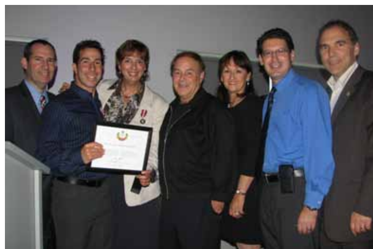
Les membres du conseil municipal de Côte Saint-Luc étaient présents quand le maire Anthony Housefather a reçu la Médaille du jubilé de la reine, le 5 juin dernier.