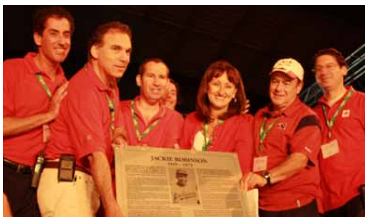
La ville a honoré Jackie Robinson sur sa Promenade des droits de la personne au cours d'une cérémonie tenue le jour de la Fête du Canada au parc Pierre Elliott Trudeau.

Nous avons même créé un premier mini parc à l'intersection Caldwell et Mackle pour honorer le centenaire du Centre gériatrique Maimonides Donald Berman.